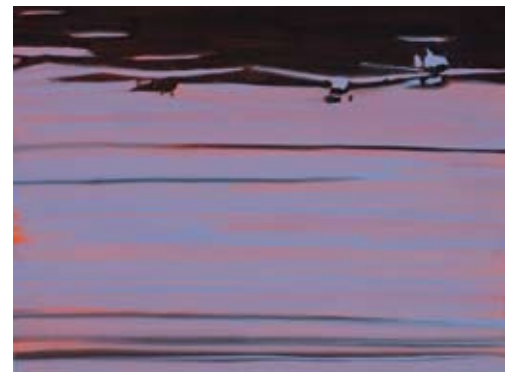
rechts boven: Christine Philipp Flugzeuge 2007, olie op papier op board, 27x36 cm