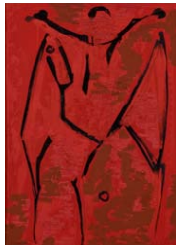
Marino Marini (1901-1980)

De reputatie van The European Fine Art Fair als 's werelds mooiste en best verzorgde kunstbeurs is reeds jaren gevestigd. Dat gold tot voor enkele jaren met name voor het aanbod aan 'Old Masters' en 'Antiquities'. De spectaculaire groei, wereldwijd, in de belangstelling voor moderne en hedendaagse kunst is natuurlijk ook niet voorbijgegaan aan TEFAF. De 'Modern Section' is sinds een aantal jaren uitgebreid met de internationaal meest toonaangevende galeries en overtreft inmiddels in expositie oppervlak alle andere secties. BORZO toont in stand 442 de aanwinsten aan een breed geïnteresseerd en internationaal publiek. TEFAF Maastricht van 7 t/m 16 mrt 2008