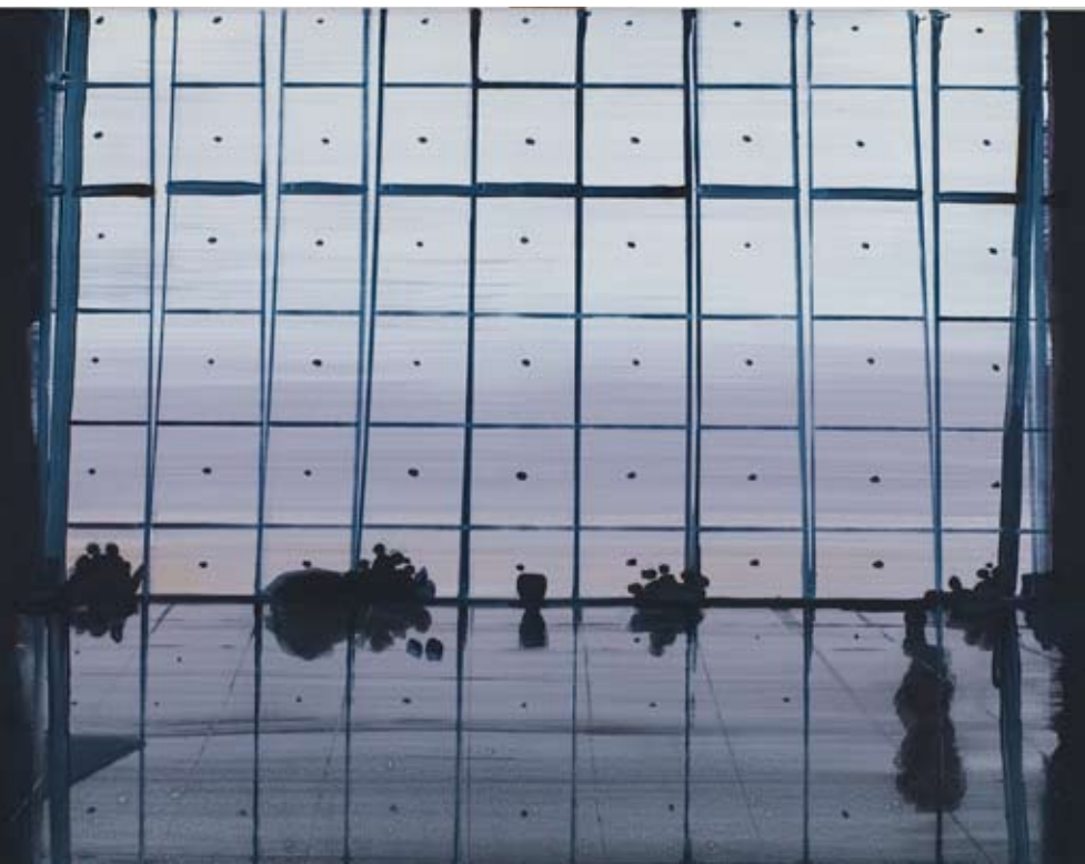
Christine Philipp Airport 2007 olie op doek, 60x80 cm