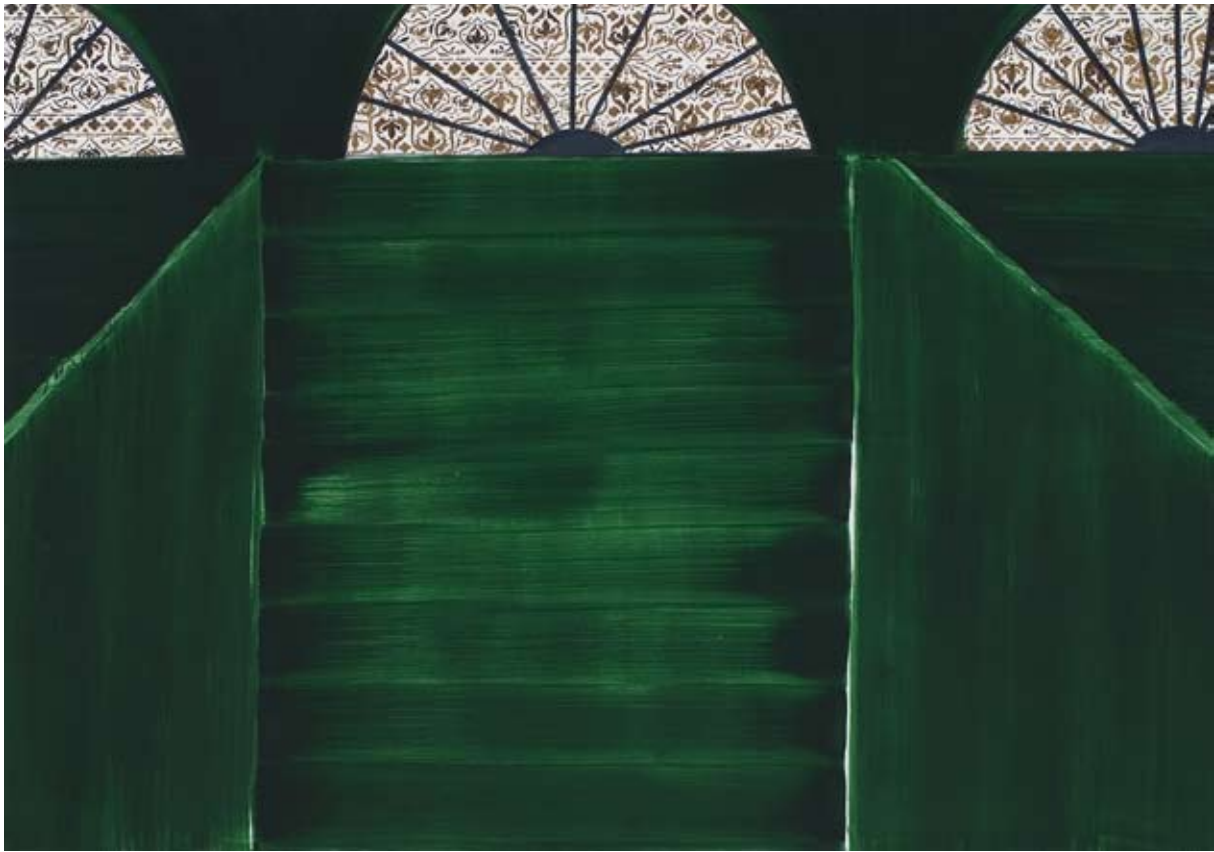
Christine Philipp Cabin 2007, olie op doek, 125x180 cm

Daardoor durf ik meer mijn eigen ding te doen, en heb ik weer extra veel plezier in het schilderen gekregen’.