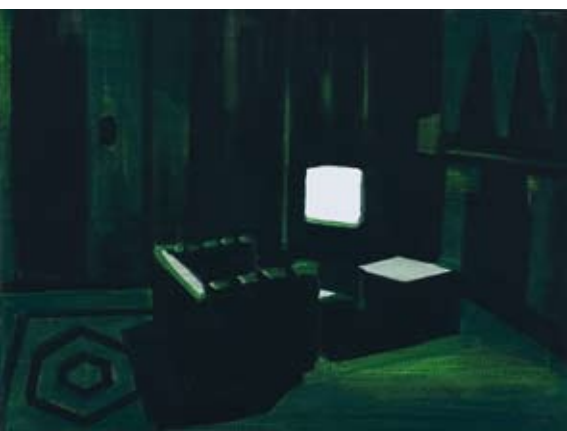
Christine Philipp Them II 2007, olie op doek, 30x40 cm

'Jonge schilders werken abstract', kopt NRC (20 oktober 2007) boven een recensie naar aanleiding van de uitreiking van de Koninklijke Prijzen voor de Vrije Schilderkunst en de expositie ervan in het Haags Gemeente Museum.