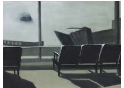
Christine Philipp Wartehalle 2007 olie op papier op board, 29.7x42 cm