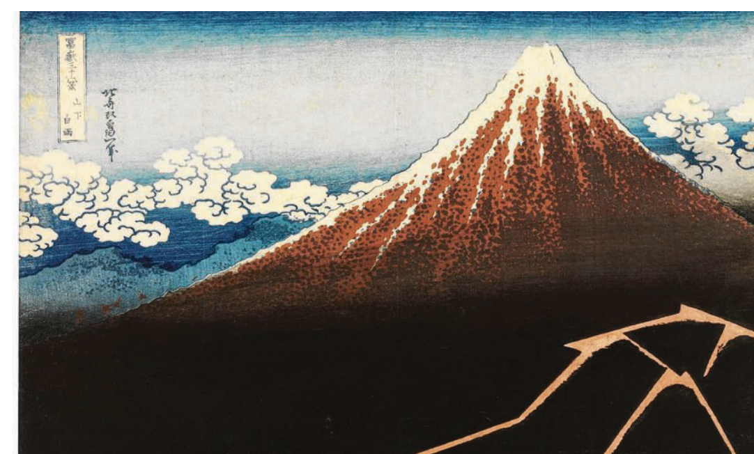
Katsushika Hokusai: Regenstorm onder de top , circa 1831.

JAPANESE PRENTKUNST Zelden te zien: de kwetsbare Grote Golf -prenten van Hokusai op een kleine maar bijzondere expositie in het Japanmuseum Sieboldhuis in Leiden.