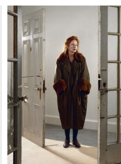
Rebecca Horn in 1994.

Horn werd in de jaren zestig en zeventig een opvallende figuur in de performance art die gerelateerd was aan Fluxus, de stroming binnen de kunst die met humor en speelsheid maatschappelijke en culturele conventies bevroeg. Bekend werd Uncorn (1970), het kostuum van een eenhoorn: een medestudent voerde een performance uit met een enorme hoorn bovenop haar hoofd en strepen op het lichaam. Zo toonde Horn de fluïde relatie tussen mens en dier, lopend door het hoge gras. Met vleugels, veren maskers, dunbenige tafels, zilveren schommels en pauwenveren in verschillende werken toont ze haar liefde voor ornithologische