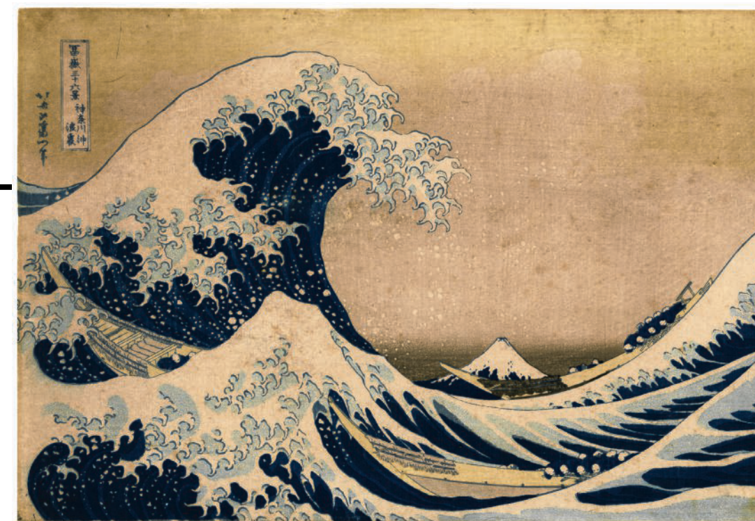
Katsushika Hokusai: De Grote Golf, circa 1831.

NAP+ , do 12 t/m zo 15 sept, Donauweg 11, Amsterdam. Er zijn 38 deelnemende galeries (ruim 100 kunstenaars). Ook is er een groepstentoonstelling van 22 opkomende kunstenaars van KABK Den Haag, Rietveld Academie, Rijksakademie en de Ateliers. Echobox Radio zendt ter plekke live uit. Tickets: €12,50. Info: nappus.nl