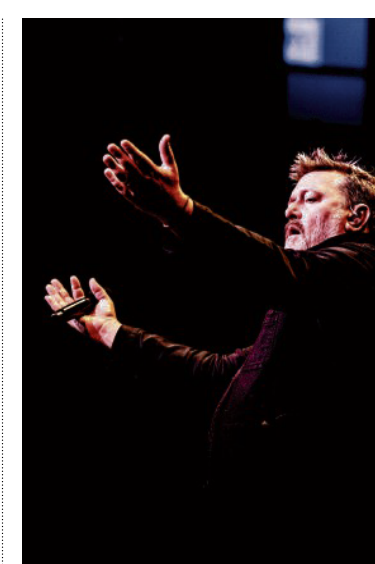
Elbow in Carré.

vrienden na een los van elkaar opgenomen Covid-plaat, weer echt samen in de studio stonden. Maar ook omdat ze hun meezingbare poprock inkleuren met meer wendingen en andere invloeden. Zo is de aardse blueshoek van albumopener 'Things I've Been Telling Myself for Years' waarmee ze vanavond ook in Carré aftrappen, op een wonderlijke manier meteen opwindend. Prettig zompig, waar hun beste nummers het eerder juist van hun weelderigheid moesten hebben. Een moment later zijn het niet alleen de funkblazers en groove van het nieuwe 'Lovers Leap' waarmee Elbow zichzelf een nieuw leven inblaast, het is ook de warm zoemende vocoder die de zang nieuwe diepte geeft. Later klinkt de band net zo makkelijk fel en bijtend.